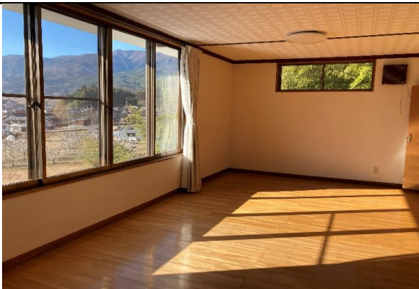
広々とした2のF洋室。眺望も日当たりも良好。