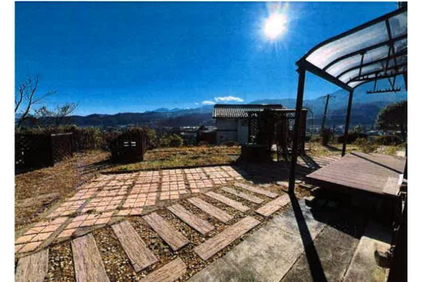
日当たりの良いテラスと東側庭の様子。