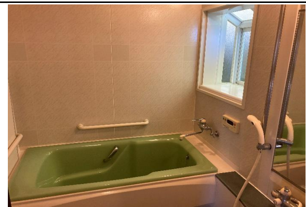
手摺付きのユニットバス