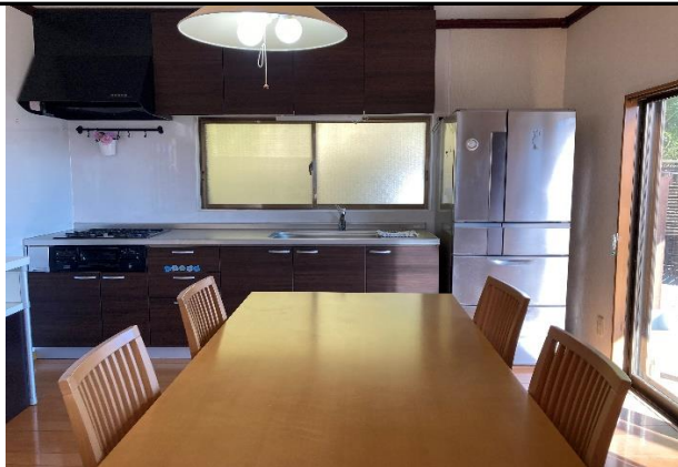
綺麗なシステムキッチン