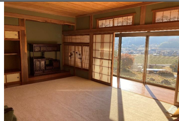
日当たりの良い明るい和室