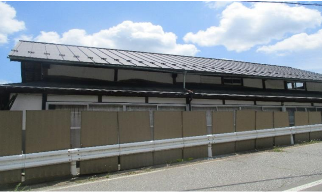
西側道路よりの外観