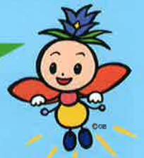
長野県選挙啓発 マスコットキャラクター 「ほたりちゃん」